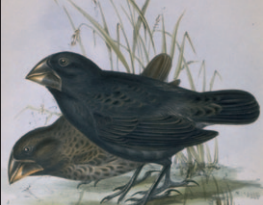
Wissenschaften verändern das Weltbild