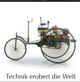
Technik erobert die Welt