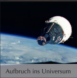
Aufbruch ins Universum